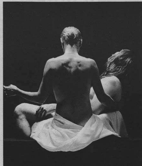
■ Podgorski. La Pietà, l'une des 500 photographies portant le même nom.

Gregor Podgorski, photographe, exposera un travail monumental. L'artiste a réalisé plus de 500 photographies de couple avec pour point commun « la légendaire pose de la Pietà de Michel Ange ».